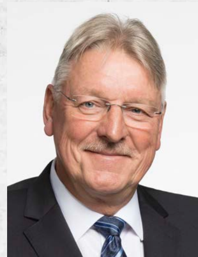
Ihr Bürgermeister Jürgen Roith

Ich wünsche Ihnen allen einen schönen Wonnemonat Mai.