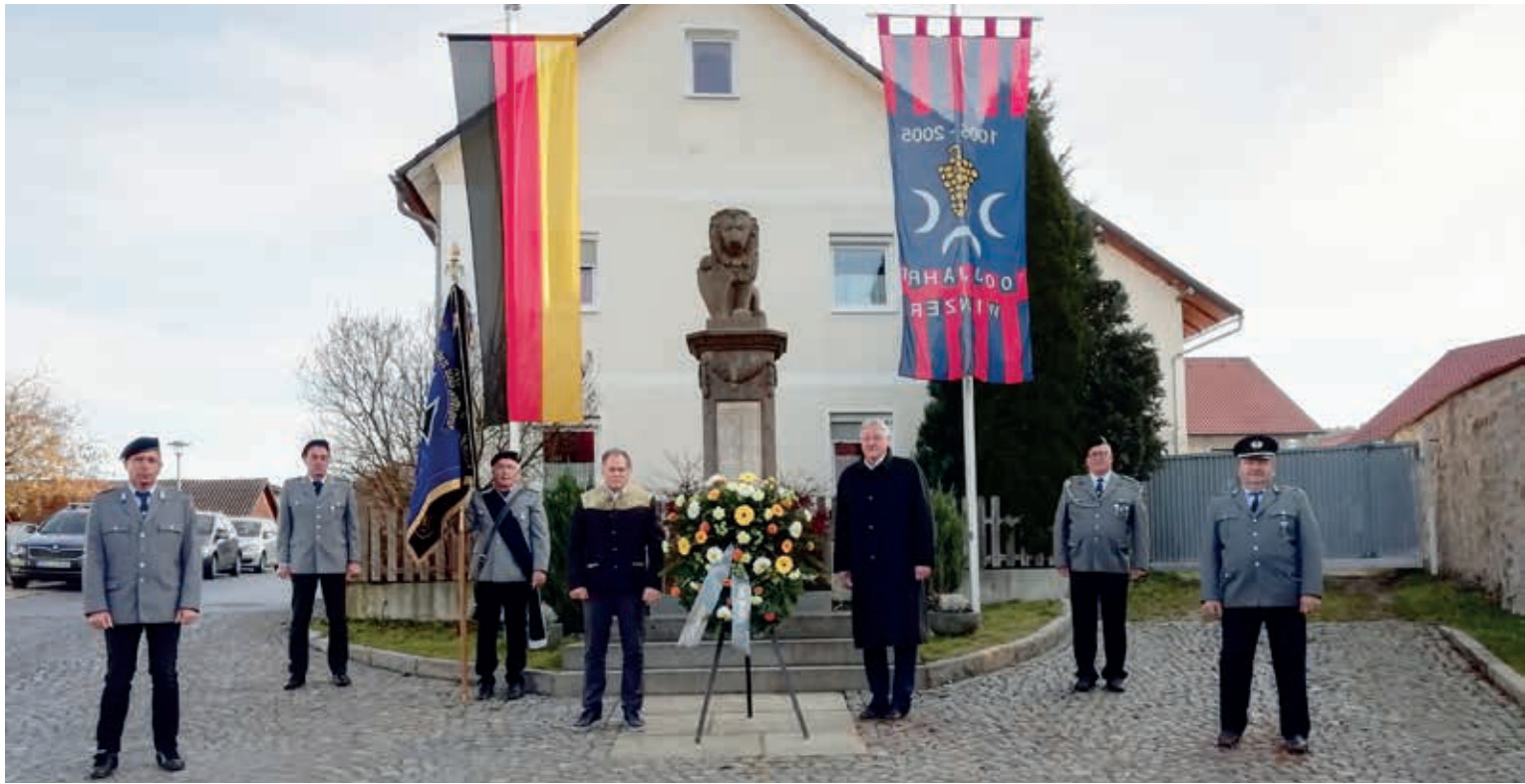
Foto: Volkstrauertag 14.11.2021

Treffpunkt ist um 09:45 Uhr beim Kindergarten Neßlbach mit anschließendem Marsch zur Pfarrkirche. Der Gedenkakt findet nach dem Gottesdienst am Kriegerdenkmal statt.